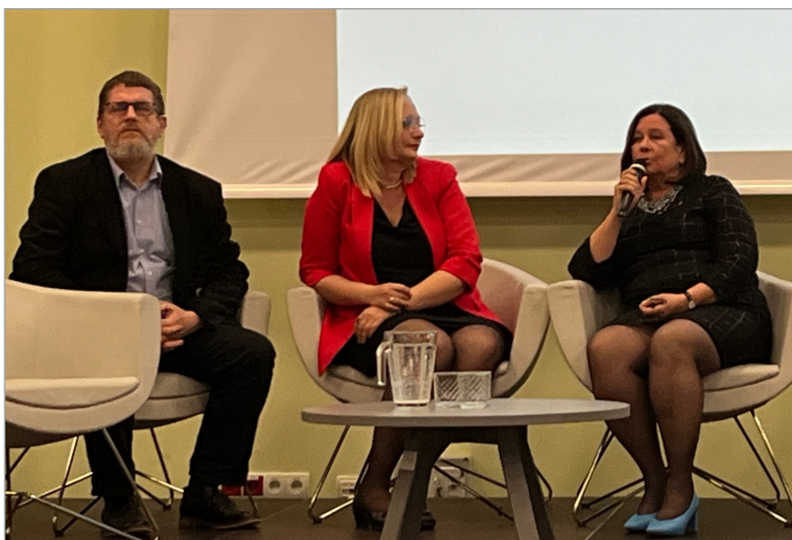
■ Konferencja odbyła się 19 października w Bydgoskim Centrum Targowo-Wystawicznym. Wzięła w niej udział liczna reprezentacja KUP OIIB.

- Wykaz kierunków studiów, które mogą być prowadzone jako jednolite magisterskie, określa rozporządzenie ministra nauki i szkolnictwa wyższego z 2018 r. Katalog ten obejmuje kierunki takie jak scenografia, reżyseria, rzeźba czy architektura. Budownictwa w tym katalogu nie ma - dlatego dziś na niektórych uczelniach można pod-