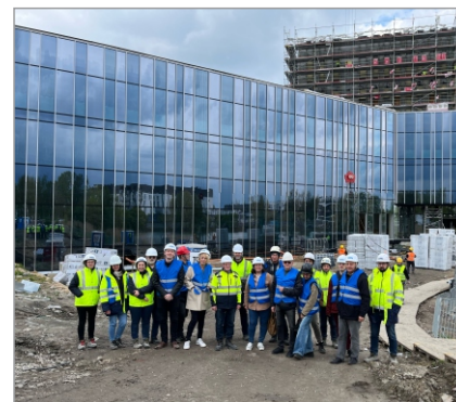
■ W wycieczce technicznej wzięło udział 15 członków KUP OIIB.

Zakończenie budowy planowane jest na jesień 2025 r. – wtedy uczelnia będzie obchodzić jubileusz 50-lecia swojej działalności. Obecnie na czterech wydziałach Akademii Muzycznej