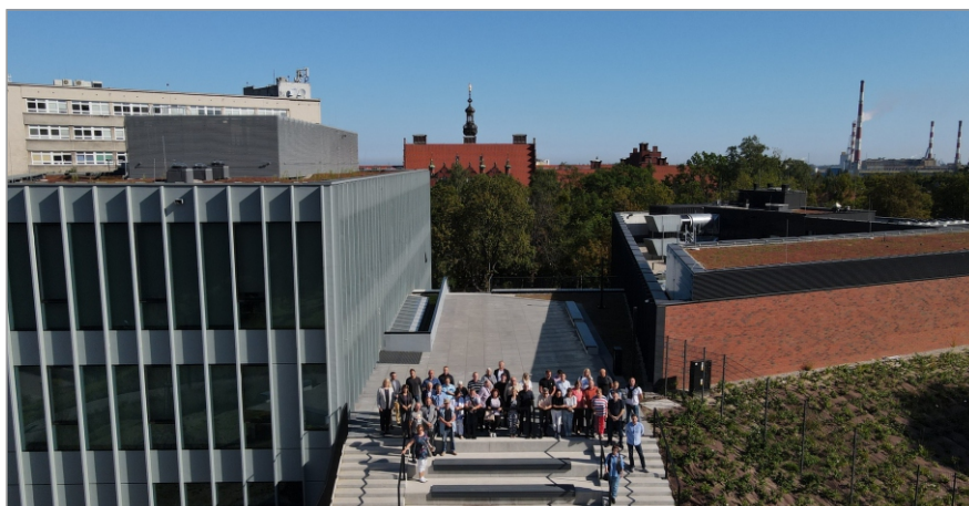
■ Członkowie KUP OIIB widziani z drona w Centrum Kompetencji STOS Politechniki Gdańskiej.