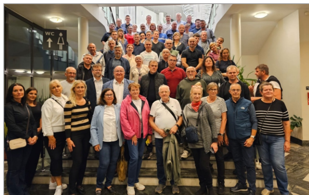
■ Uczestnicy szkolenia zwiedzili bydgoską operę w trakcie rozbudowy.