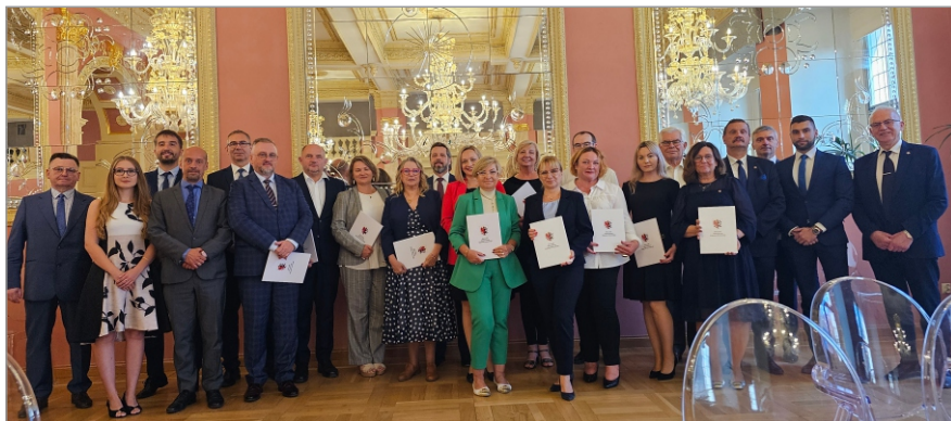
■ Porozumienie podpisali przedstawiciele 15 samorządów zawodów zaufania publicznego.

Kujawsko-Pomorskie Porozumienie Samorządów Zawodów Zaufania Publicznego tworzą: Bydgoska Izba Lekarska, Kujawsko-Pomorska Izba Lekarsko-Weterynaryjna, Kujawsko-Pomorska Okręgowa Izba Architektów RP, Kujawsko-Pomorska Okręgowa Izba Inżynierów Budownictwa, Kujawsko-Pomorska Okręgowa Izba Lekarska, Kujawsko-Pomorski Oddział Krajowej Izby Doradców Podatkowych, Okręg Kujawsko-Pomorski Polskiej Izby Rzeczników Patentowych, Okręgowa Izba Pielęgniarek i Położnych w Bydgoszczy, Okręgowa Izba Pielęgniarek i Położnych w Toruniu, Okręgowa Izba Pielęgniarek i Położnych we Włocławku, Okręgowa Izba Radców Prawnych w Bydgoszczy, Okręgowa Izba Radców Prawnych w Toruniu, Okręgowa Rada Adwokacka w Bydgoszczy, Okręgowa Rada Adwokacka w Toruniu, Pomorsko-Kujawska Okręgowa Izba Aptekarska. (PG)