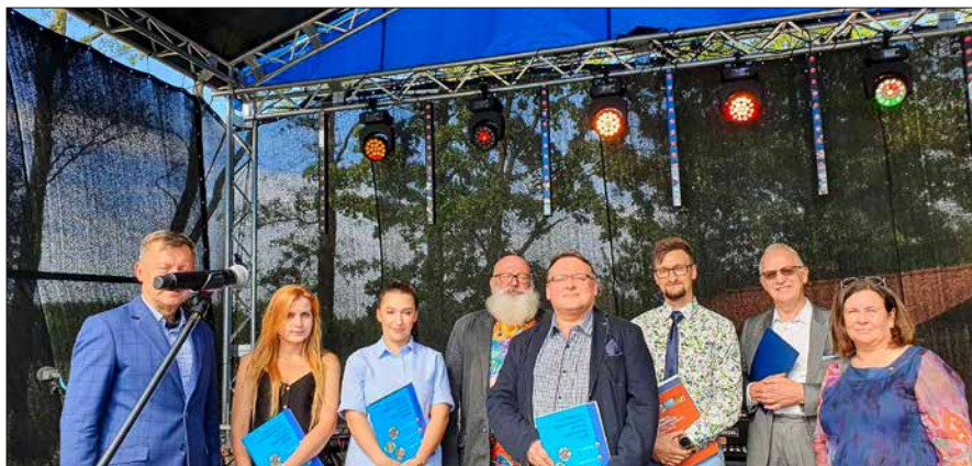
■ Laureaci konkursu na najlepsze prace dyplomowe wraz z promotorami.

Po dwóch latach przerwy spowodowanej epidemią koronawirusa członkowie naszej Izby spotykają się na spotkaniach integracyjnych z okazji Dni Budowlanych. Pierwsza impreza odbyła się w Bydgoszczy. Piknik w Przystani „Zimne Wody”, położonej nad brzegiem Brdy, przyciągnął kilkaset osób.