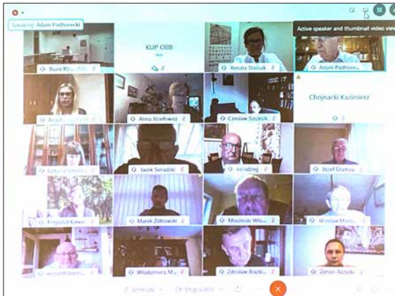
■ Spotkania Okręgowej Rady KUP OIIB odbywają się obecnie w trybie telekonferencji, coraz bardziej rozpowszechnionej w wielu branżach.

Paradoksalnie, trudne warunki epidemiczne spowodowały dynamiczny rozwój szkoleń branżowych w formule on-line. Ze statystyk PIIB wynika, że w okresie od marca do września 2020 r. w jakiejś formie doskonalenia zawodowego przez internet wzięło udział ponad 2300 osób należących do KUP OIIB, co stanowi około 40% ogólnej liczby członków. Zasadniczą zaletą takiej formy szkoleń jest ich lepsza dostępność – wystarczy mieć komputer z dostępem do internetu oraz aktywne konto na Portalu PIIB, by móc z dowolnie wybranego przez siebie miejsca połączyć się z prelegentem i uczestniczyć w wykładzie. Wiadomo, że z udziału w szkoleniach stacjonarnych niektórym chętnym zdarzało się rezygnować z powodu trudności logistycznych w dotarciu na miejsce i wygospodarowaniu czasu w ciągu dnia aktywnej pracy zawodowej. Kolejnym niekwestionowanym atutem wykładów i seminariów on-line jest poszerzenie oferty szkoleniowej dostępnej dla członków okręgowych izb – obecnie możemy uczestniczyć w szkoleniach organizowanych przez wszystkie okręgowe izby, a nie tylko przez naszą własną. Oznacza to, że w każdym miesiącu do