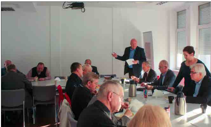
■ W roku 2016 nasza Izba po raz pierwszy zorganizuje konkurs „Prymus budownictwa”