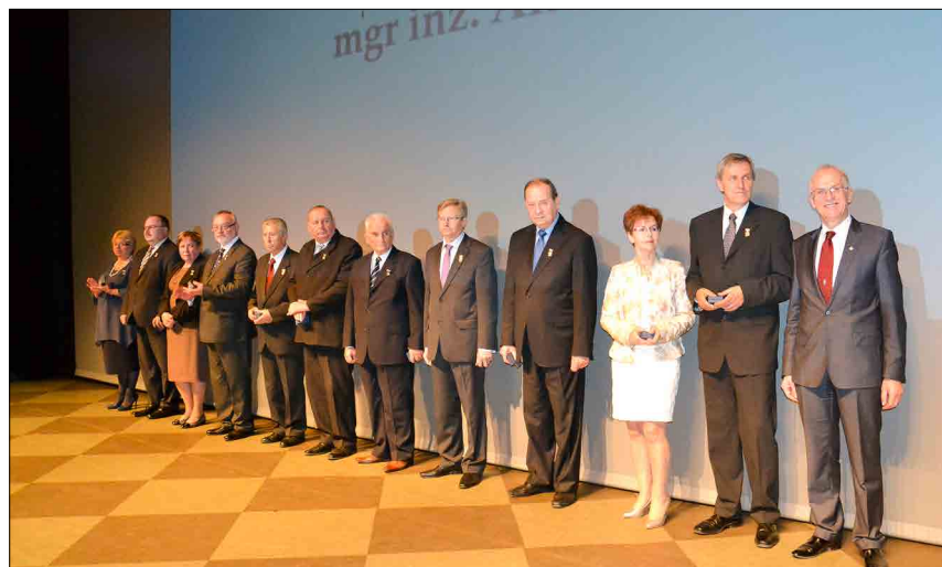
■ Honorowe odznaki PIIB dla najbardziej doświadczonych i aktywnych działaczy Izby

Wszystkim wyróżnionym i nagrodzonym serdecznie gratulujemy! ■