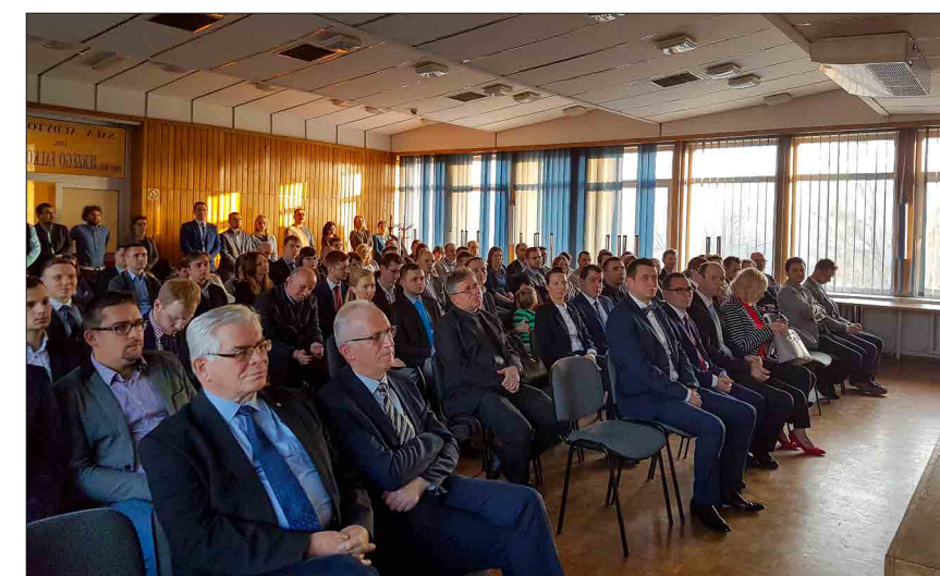
■ Wręczono 85 decyzji o uzyskaniu uprawnień budowlanych zdającym w jesiennej sesji egzaminacyjnej. Na uroczystości pojawili się wszyscy uprawnieni