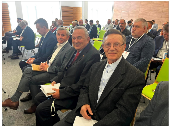
■ W XXII Zjeździe Sprawozdawczym KUP OIIB wzięło udział 84 delegatów. Frekwencja wyniosła 77%.

samorządach zawodowych architektów i inżynierów budownictwa, Statutu PIIB oraz regulaminów, Izba podejmie szereg własnych inicjatyw. Do najważniejszych z nich należy kontynuowanie konkursów „Prymus Budownictwa” (w nowej, szerszej formule)