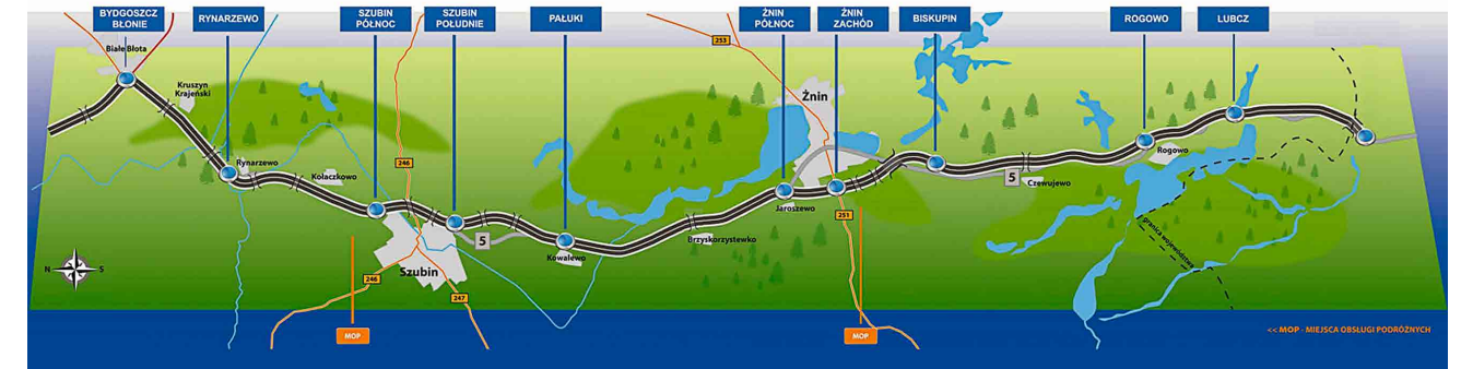
■ Droga ekspresowa S5 Bydgoszcz - granica województwa