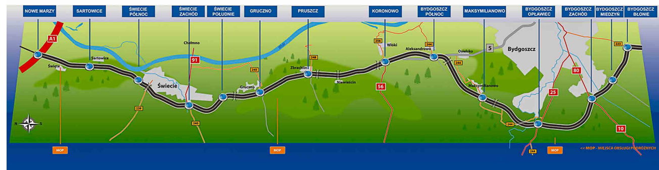
■ Droga ekspresowa S5 Nowe Marzy - Bydgoszcz

Inwestycja obejmować będzie m.in.: budowę dwóch jezdni drogi ekspresowej (każda po dwa pasy ruchu), budowę węzłów drogowych, przebudowę istniejących węzłów, budowę obiektów inżynierskich, przebudowę istniejącej sieci dróg publicznych oraz budowę chodników, ścieżek rowerowych i zatok autobusowych, budowę wzdłuż drogi ekspresowej dróg dojazdowych/serwisowych wraz ze zjazdami na przyległe działki, budowę urządzeń ochrony środowiska (m.in. ekrany akustyczne i przejścia dla zwierząt), budowę i przebudowę oświetlenia drogowego, wykonanie oznakowania oraz urządzeń bezpieczeństwa ruchu (m.in. barier ochronnych), osłon przeciwośnieńowych, balustrad, budowę Miejsc Obsługi Podróżnych, budowę Obwodów Utrzymania Drogi, budowę wjazdów, zjazdów i przejazdów awaryjnych.